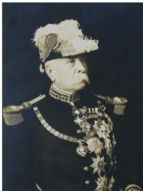
Porfirio Díaz, n.d.