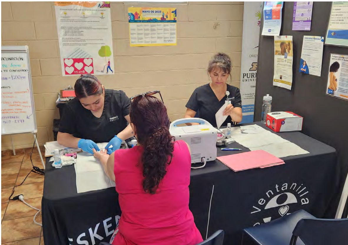
Feria de salud del Consulado de México, 2023