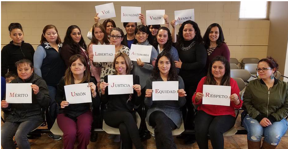
La personal en el Día Internacional de la Mujer, 2018