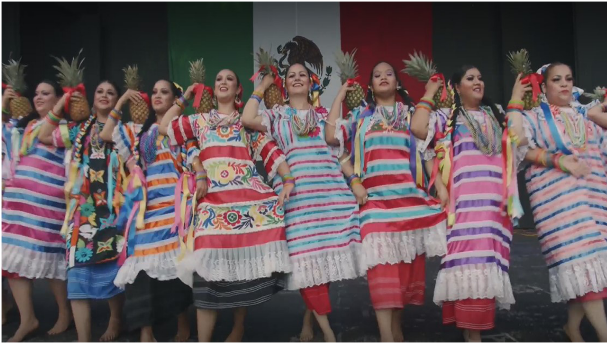
Celebración del Día de Independencia de México ( enlace ), 2019

El departamento de Asuntos Comunitarios promueve la cultura, la historia, las tradiciones y la identidad mexicana a través de la participación en festivales que promueven la diversidad étnica y cultural.